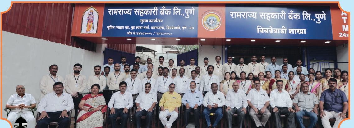
रामराज्य सहकारी बँकेचे संचालक मंडळ व कर्मचारी बंधू-भगिनी