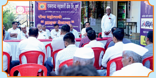
रौप्य महोत्सवी वर्षानिमित्त आयोजित नसरापूर शाखेतील ग्राहक मेळाव्यास उपस्थित जनसमुदाय.