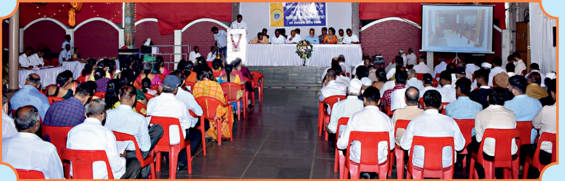
बँकेच्या २५व्या वार्षिक सर्वसाधारण सभेसाठी उपस्थित असलेले सभासद बंधू-भगिनी.