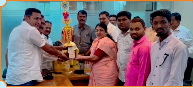
सन २०२२-२३ या वर्षाचा उत्कृष्ट शाखा पारितोषिक स्वीकारताना धनकवडी शाखेचा कर्मचारी वर्ग.